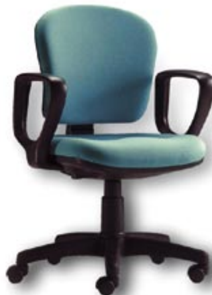
KETY nízká 01-03-10-1