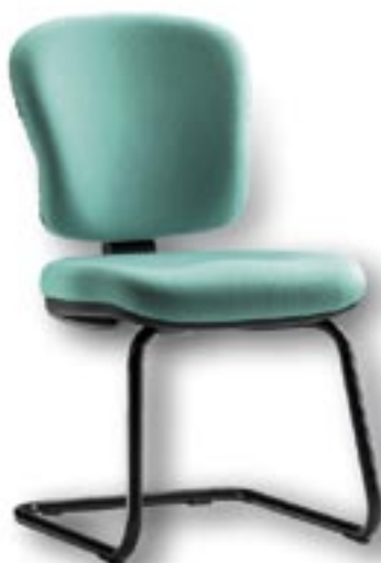
KETY jednací 03 01-03-14-1