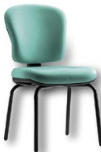
KETY jednací 04 01-03-15-1