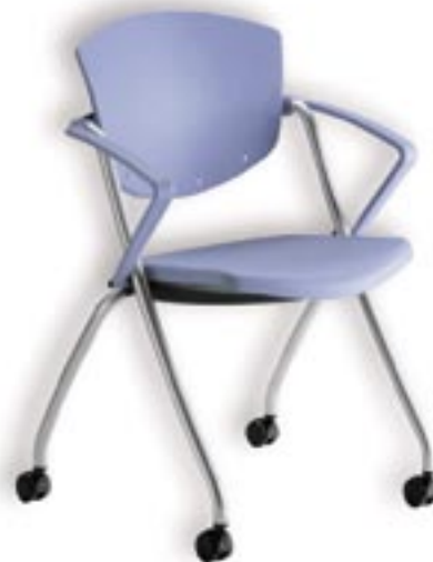
EASY GO plast s područkami V, kostra stříbrná 92-11-70-2