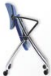
sklopný sedák jako standard