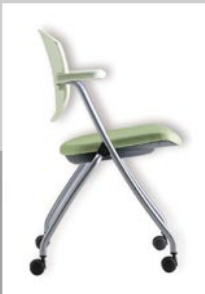
EASY GO čalouněný sedák s područkami short, kostra stříbrná 92-12-70-2