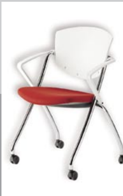
EASY GO čalouněný sedák s područkami V, kostra chrom 92-12-70-3