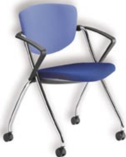
EASY GO čalouněná s područkami V, kostra chrom 92-10-70-3