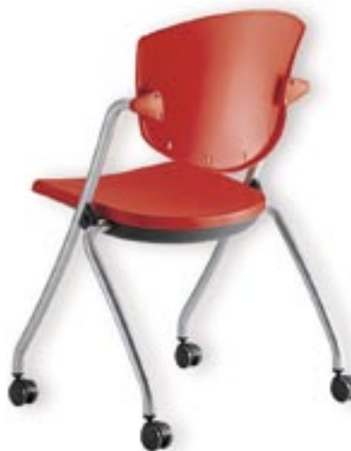
EASY GO plast bez područek, kostra stříbrná 92-11-71-2