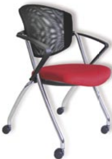
EASY GO síť s područkami V, kostra chrom 92-06-70-3