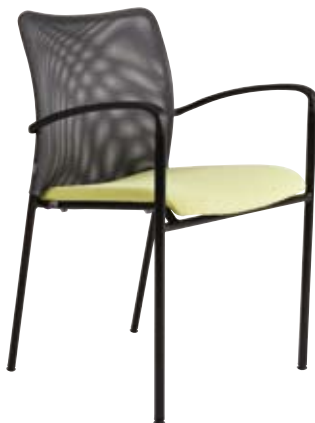
6. SPRING NET 25-12-70-1