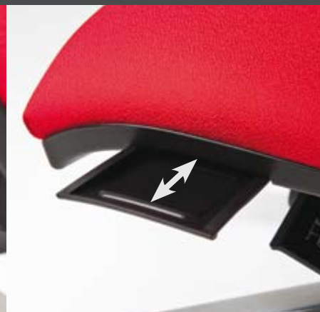
Praktická přihrádka třeba na vizitky

Varianta židle s integrovaným posunem sedáku