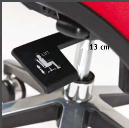
Úprava výšky sedáku