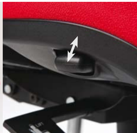
Tlačítko pro posun sedáku