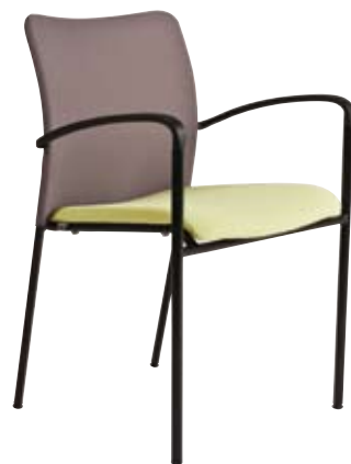
3. SPRING SLIM 25-05-70-1