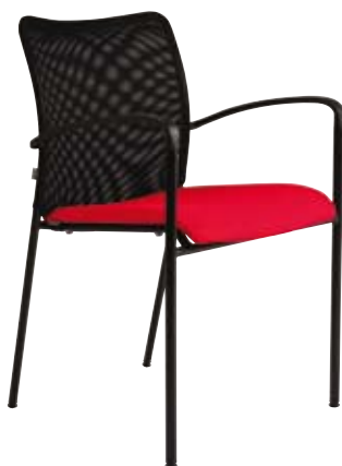
2. SPRING NET 25-06-70-1