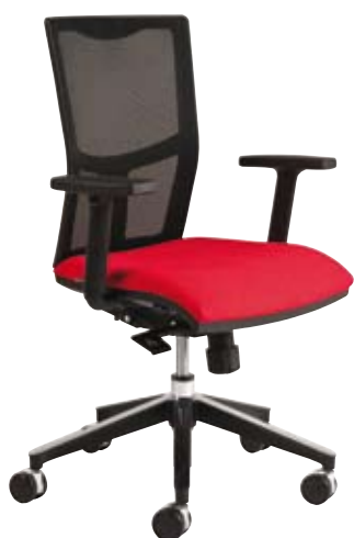
1. SPRING NET 25-06-29-1

oporu a zároveň cirkulaci vzduchu. Pro větší komfort lze židli vybavit integrovaným posunem sedáku, který umožňuje jednoduchým stiskem tlačítka horizontální posun sedáku v rozmezí šesti centimetrů. Dalším praktickým doplňkem tohoto sedáku