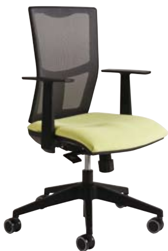
5. SPRING NET 25-12-12-1

Jednací židle SPRING je s možností výběru opěráku z černé nebo šedé síťoviny ( SPRING NET ) nebo tenkého opěráku ocalouněného látkou ( SPRING SLIM ).