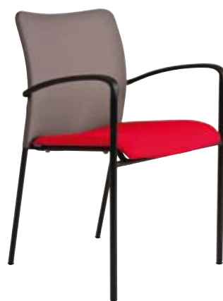
4. SPRING SLIM 25-05-70-1