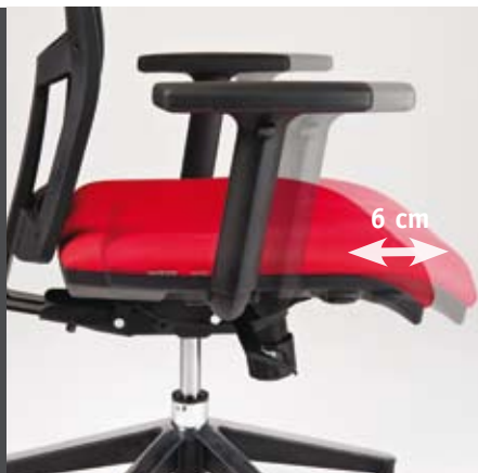
Integrovaný posun sedáku